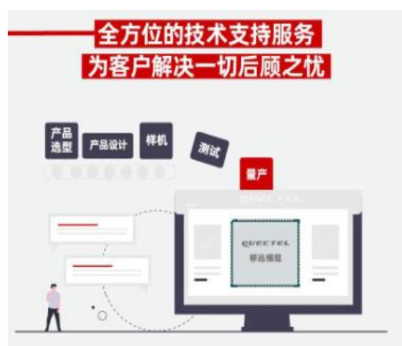
全方位技术服务优势