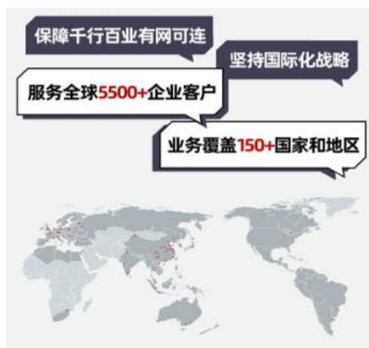
全球业务布局优势