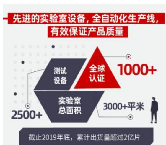
产品质量和规模优势